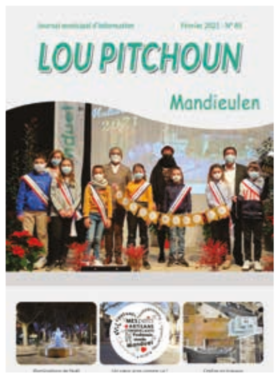
Lou Pitchoun 2 parutions par an