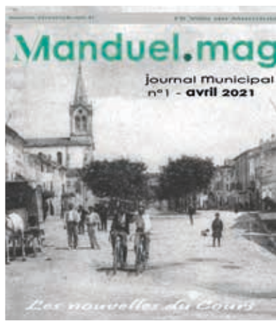
Le dernier né Manduel.mag Bientôt disponible