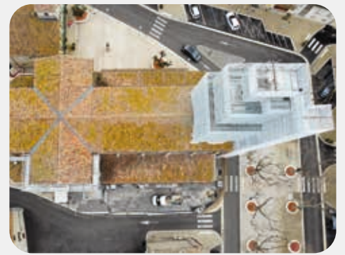
L'église en travaux