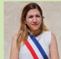
Marine PLA 4 e Adjointe Urbanisme et aménagement du territoire

“ L’objectif premier de cette révision générale du PLU est de garder à la commune sa dimension de village. ”