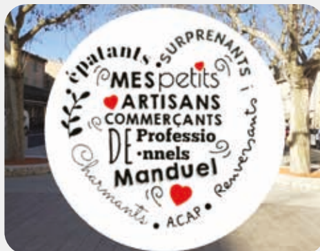
Un cœur gros comme ça !