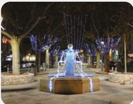
Illuminations de Noël