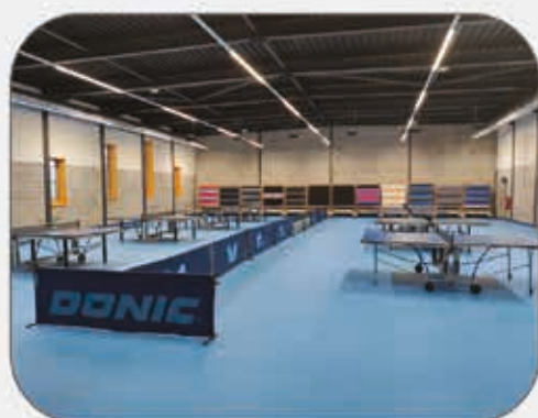
Le DOJO 2 a ouvert ses portes