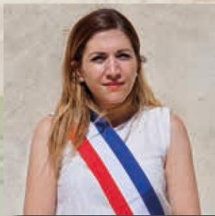
Marine PLA 4 e adjointe Urbanisme et aménagement du territoire