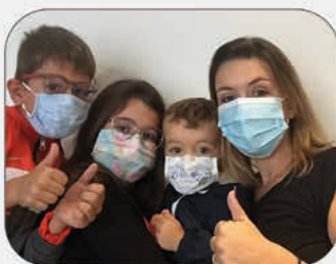
Notre quotidien avec le COVID