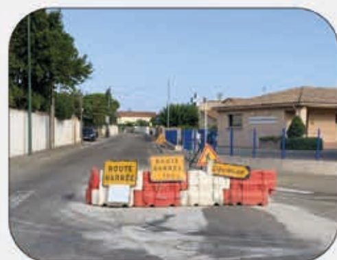
Chemin de Saint-Paul rénovation en cours