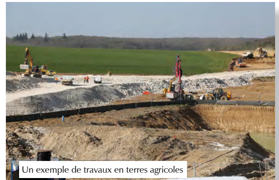
Un exemple de travaux en terres agricoles

► Les maîtres d'ouvrage publics ou privés, en charge de la réalisation de travaux, d'ouvrages ou d'aménagements susceptibles d'impacter l'économie agricole du territoire.